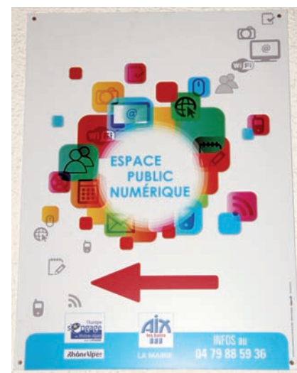
● Affiche d'inauguration de l'EPN d'Aix-les-Bains