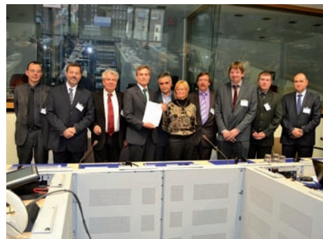
● Remise du rapport final du réseau CASH à Bruxelles